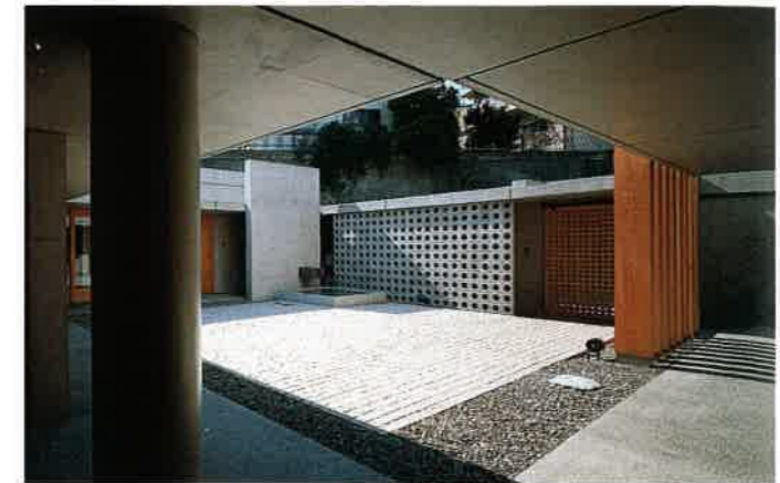
中庭はピンコロ石（角100mm）敷き、中庭の周りには回廊が巡らされ、司祭室や集会室が配置されている。左奥の集会室側は壁式構造、右手前の聖堂はラーメン構造。