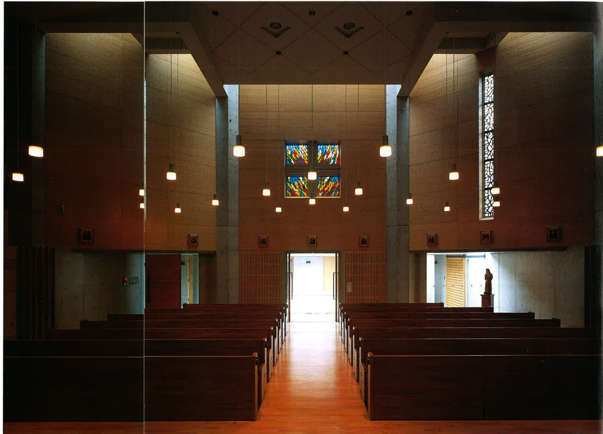
聖堂内観。天井高7,460mm、100人を収容できるこ