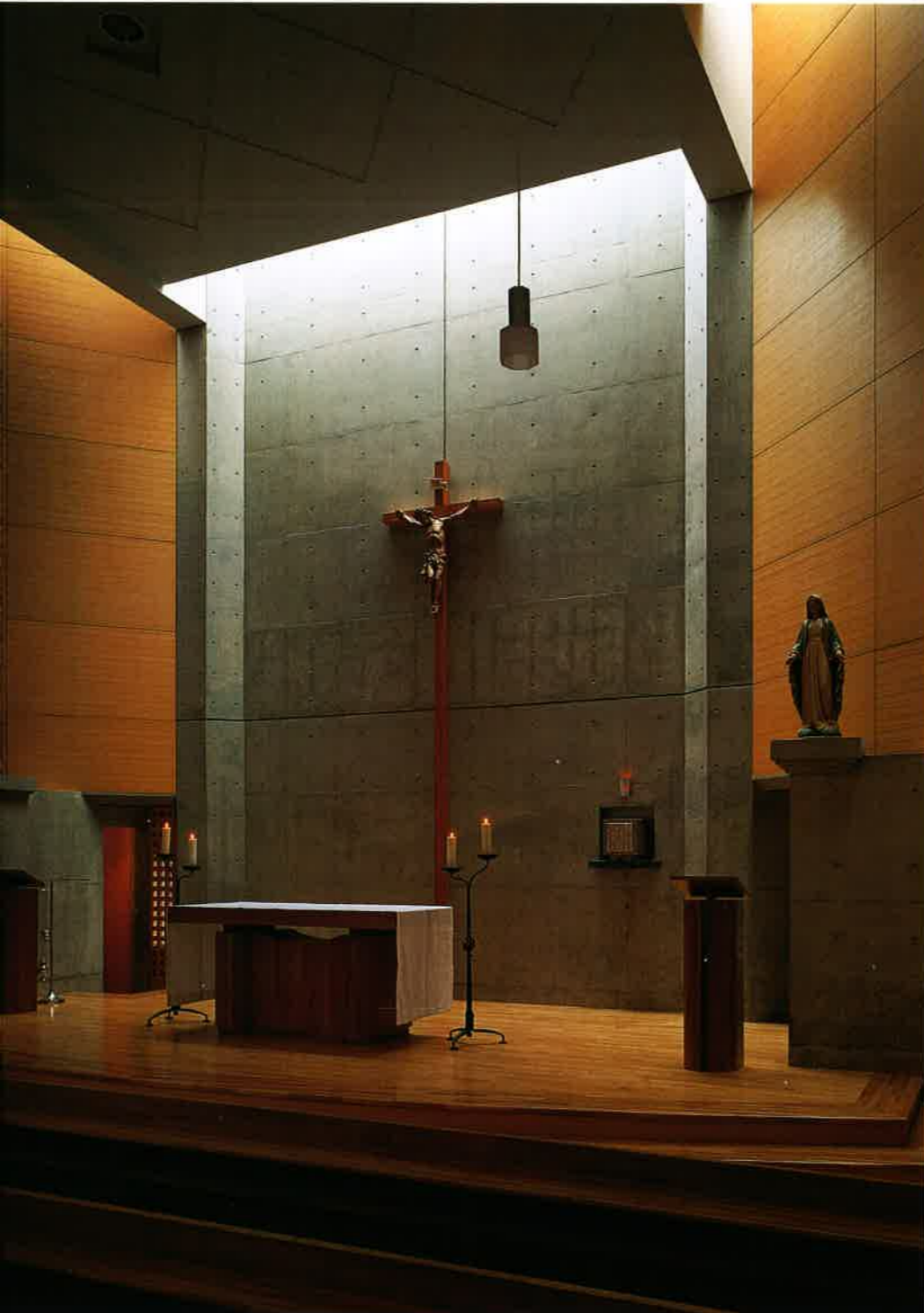
聖堂の祭壇側を見る。周囲からの騒音や視線を防ぐために開口部は少なくされており、上部のトップライトやスタンドグラスから採光を得ている。