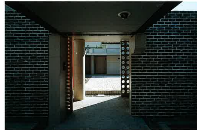
道行から開かれた格子扉越しに中庭を見る。庇の高さは2,150mm。