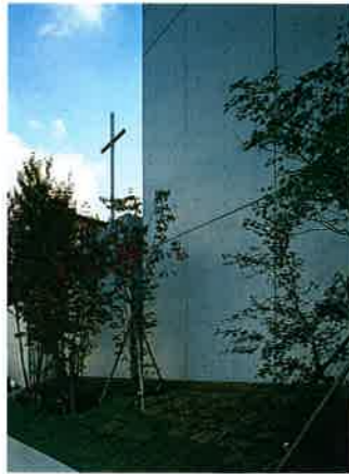
道路に面した北側外観。手前は聖堂外壁、十字架の下は聖具室外壁。