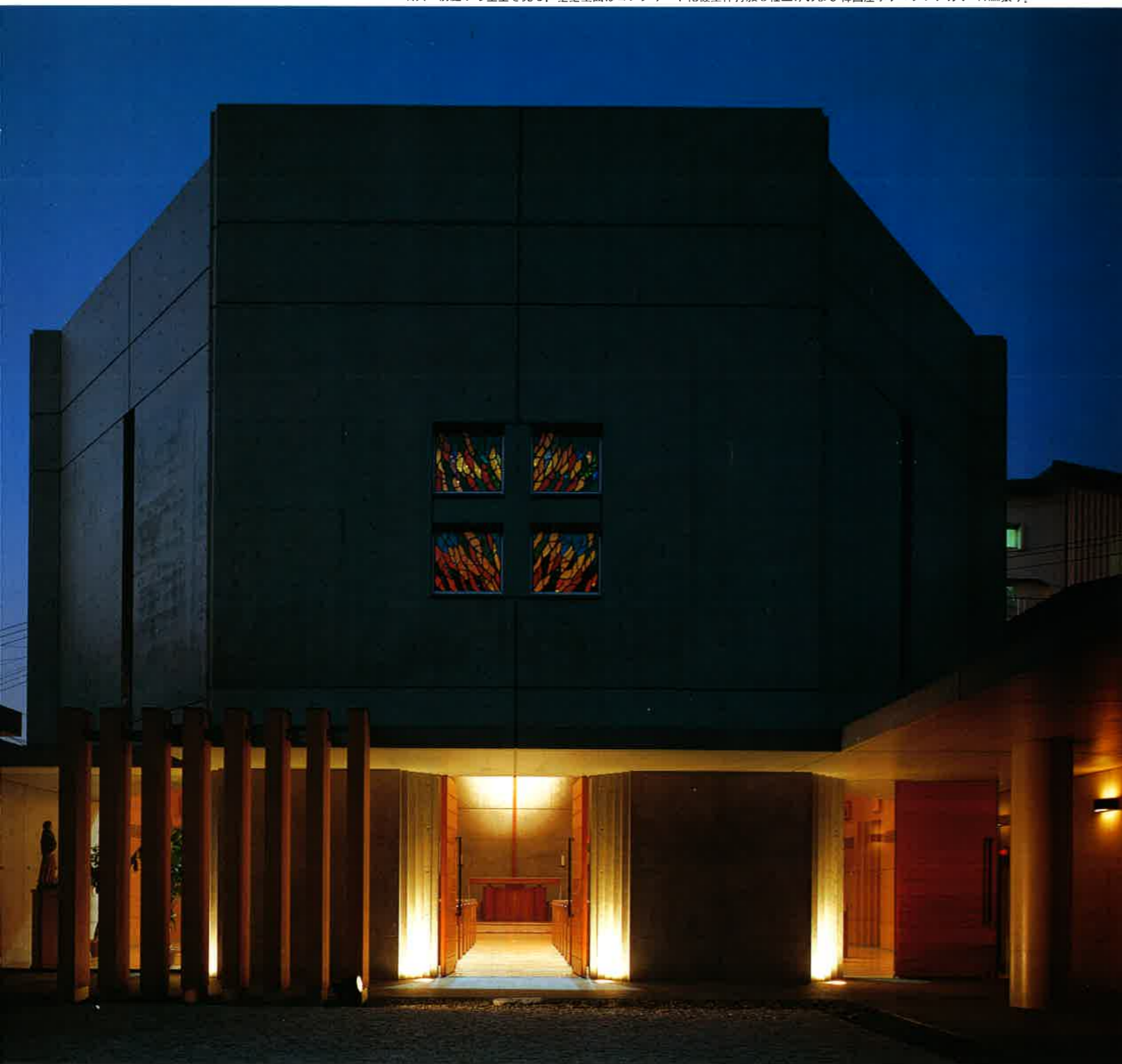
中庭から見た夜景。

右頁：前庭から聖堂を見る。聖堂壁面はコンクリート化粧型枠打放し仕上げおよび韓国産ホフマンレンガt=17mm張り。